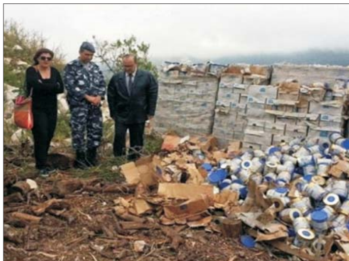
Vingt tonnes de boîtes de lait pour nourrissons, périmées et abandonnées près d'un camp au Liban pour réfugiés syriens, 2015

Fournir du lait pour nourrissons pendant les situations d'urgence crée des marchés juteux dans les pays en voie de développement et augmente les déchets tout en laissant des empreintes écologiques (carbone, matières premières, eau) beaucoup plus élevées que pour le lait maternel.